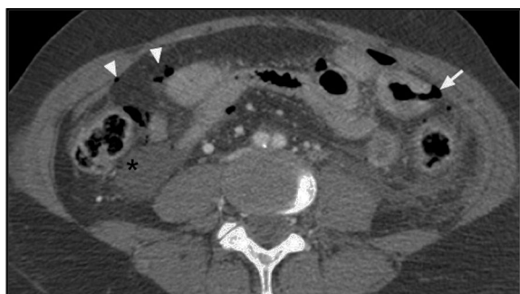
Figura 1 TC de abdomen en el que se observa líquido peritoneal (asterisco), neumoperitoneo (puntas de flecha) y foco de perforación intestinal (flecha) de un asa intestinal de pared engrosada.

Varón de 31 años trasladado a urgencias de nuestro hospital por politraumatismo tras accidente de tráfico. Se realizó TC «total body» en donde se apreció hemoperitoneo, escaso neumoperitoneo y engrosamiento difuso de asas intestinales (fig. 1). Existía ausencia de realce tras contraste intravenoso (CIV) de un asa yeyunal, compatible con hipoperfusión (fig. 2) y focos de perforación intestinal (fig. 1). Se realizó cirugía urgente que confirmó el asa isquémica tras avulsión de vasos mesentéricos de pequeño calibre. La avulsión de los vasos mesentéricos por traumatismo abdominal cerrado es una entidad infrecuente, en especial sin lesión de víscera sólida asociada. Aunque el hematoma mesentérico o el extravasado de CIV son signos más específicos, debe sospecharse ante un segmento intestinal con pared engrosada e hipoperfundida, neumoperitoneo y hemoperitoneo sin lesión de víscera sólida.