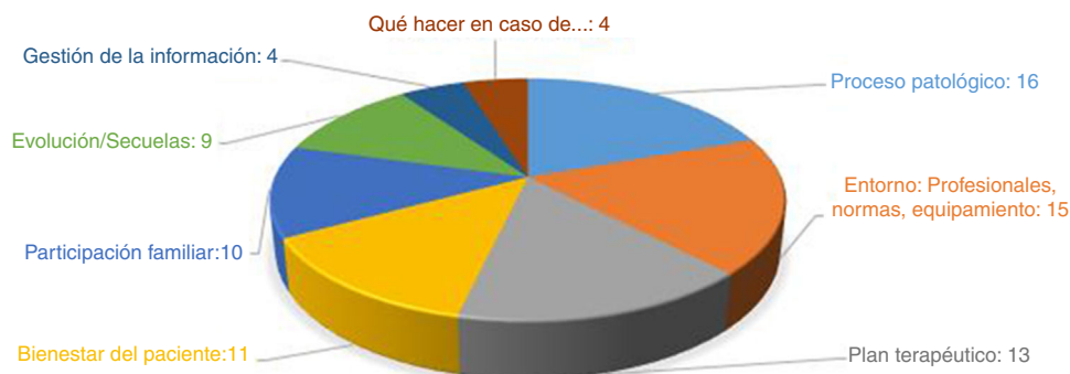
Figura 1 Categorías presentes en el «Listado final de preguntas». Las 82 cuestiones fueron agrupadas en 8 categorías. A continuación del nombre de la categoría, el número de preguntas que contenía cada una.

consideraban adecuado para resolver cada una de las 82 preguntas, pudiendo responder «médico», «enfermera/o» o «ambos». En esta fase se recibieron 654 respuestas, de las cuales 287 fueron de familiares (70%), 190 de enfermeras/os (92%) y 177 de médicos (86%), que se incorporaron a la base de datos general.