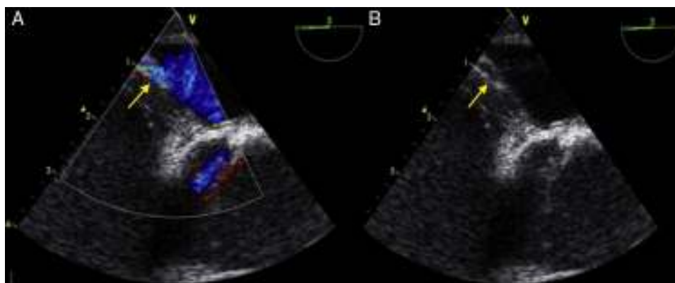
Figura 2 La ETE con Doppler color en la que se observa (flechas amarillas) un shunt derecha-izquierda (A) a través de un foramen oval permeable y el defecto en la pared interauricular (B).

tras revisar la literatura existente (hemos encontrado casos similares tras endocarditis sobre válvula tricúspide 9 y un solo caso por obstrucción protésica 10 ). Desconocemos si el FO estaba presente previamente o bien se repermeabilizó por el aumento de presiones, ya que no se realizó una ETE al ingreso. Concluimos haciendo hincapié en lo infrecuente de esta complicación, pero en la necesidad de tenerla presente ante una semiología similar a la de nuestro caso por la necesidad de llegar al diagnóstico y realizar el tratamiento quirúrgico adecuado.