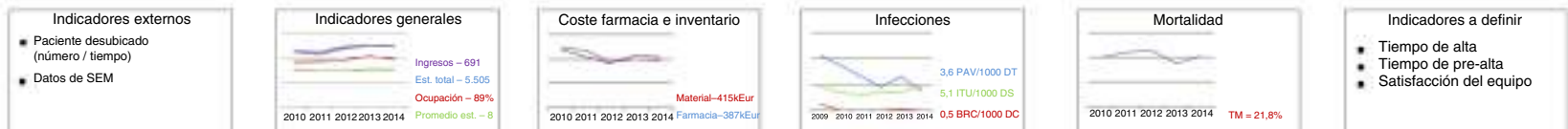
Figura 1 Panel que nos muestra el Value Stream Map o mapa de flujo del proceso de críticos. Está dividido en diferentes partes: arriba observamos el proceso del paciente crítico, debajo el flujo del paciente crítico con datos reales actualizados. Le siguen los 3 proyectos desarrollados en el periodo del estudio y detallados en el texto, y al final se presentan los indicadores de salud considerados de los pacientes críticos de la UCI.