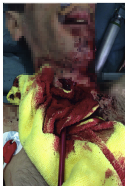
Figura 2 Esquema de las zonas en las que se divide la zona de la región cervical y fotografía de la región cervical del paciente evidenciándose la lesión por punta de flecha en zona II.