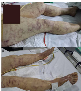
Figura 1 Imagen de livedo reticularis sobre miembros inferiores, primeras 24 h de ingreso. La afectación cutánea se extendía hasta el abdomen superior, caderas, glúteos y ambos pies con «dedos azules». En la imagen superior se aprecia drenaje, tras haber sido realizada laparotomía urgente con esplenectomía, gastrectomía y pancreatomecтомía por infartos multiviscerales.

Disponible en Internet el 25 de octubre de 2016