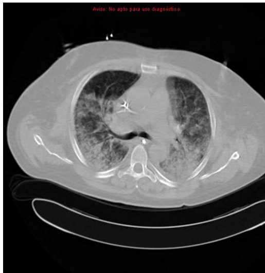
Figura 1 Tomografía computarizada torácica con presencia de condensaciones y áreas de aumento de la atenuación pulmonar en vidrio deslustrado bilateral.