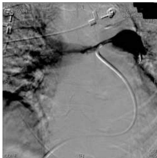
Figura 1 Arteriografía pulmonar que muestra defecto de perfusión de tronco y arteria pulmonar izquierda y del 50% de la derecha.

En UCI la paciente presentó una insuficiencia respiratoria severa con disfunción severa del ventrículo derecho refractaria a tratamiento médico máximo falleciendo a la semana de la intervención.