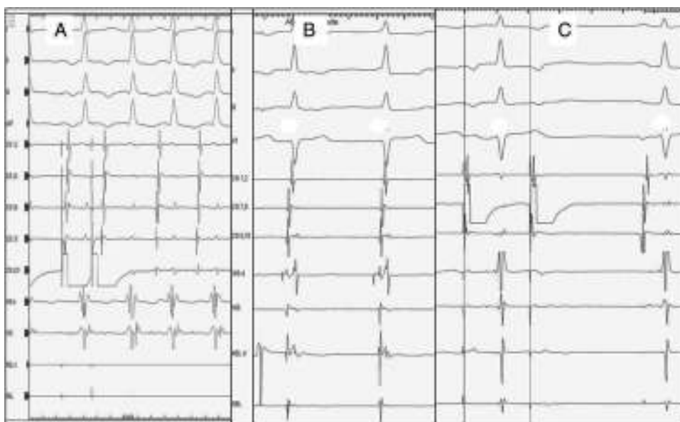
Figura 2 A) Inducción de taquicardia intranodal atípica mediante un extraestímulo con acoplamiento de 340 ms. B) Ritmo nodal durante la ablación. C) Ausencia de vía lenta tras ablación.

(Thoratec Corp., Pleasanton, California) mediante esternotomía. En el mismo procedimiento se implantó marcapasos epicárdico bicameral secuencial.