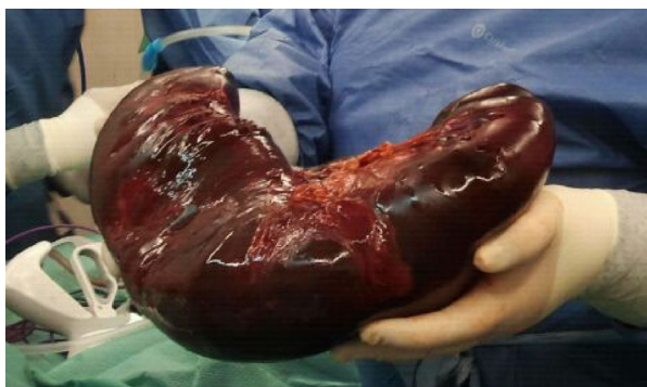
Figura 1 Pieza quirúrgica (bazo) tras esplenectomía del caso 1.