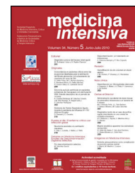
IMAGEN EN MEDICINA INTENSIVA