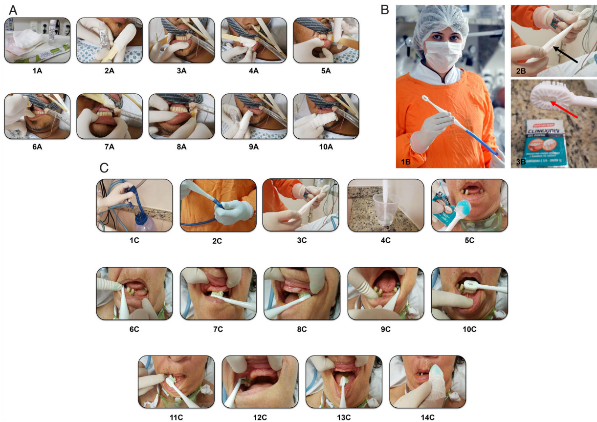
Figura 1 A) Pasos de la higienización bucal - protocolo 1: 1A) Kit de higiene; 2A) Espátula envuelta con gasa, embebida con solución antiséptica bucal (digluconato de clorhexidina al 0,12%); 3A) Cepillado vestibular de los dientes inferiores derecho; 4A) Cepillado en la región anterior inferior; 5A) Cepillado vestibular de los dientes inferiores izquierdo; 6A) Higienización vestibular de los dientes superiores derecho; 7A) Cepillado en la región anterior superior; 8A) Cepillado vestibular de los dientes inferiores izquierdo; 9A) Limpieza del tubo; 10A) Limpieza de los labios. B) Cepillo de dientes para cepillado por aspiración (DentalClean®): 1B) Cepillo conectado al sistema de aspiración por vacío del hospital; 2B) La flecha indica el orificio para el control de la aspiración. El cepillo solo aspira cuando el orificio se tapa con el dedo; 3B) La flecha indica el lugar de aspiración del cepillo. En el fondo está el saché conteniendo digluconato de clorhexidina al 0,12% en gel, fabricado y suministrado por DentalClean® (Industria brasileira, Londrina-PR, Brasil). C) Pasos de la higienización bucal - protocolo 2: 1C) Frasco colector; 2C) Conexión tubo de succión al vacío del hospital con el cepillo de succión; 3C) Cepillo conectado; 4C) Cepillo de dientes incrustado en solución no alcohólica de clorhexidina al 0,2%; 5C) Kit de higiene - clorhexidina gel al 0,12%; 6C) Movimientos vaivén presionando levemente las cerdas contra la encía superior derecha; 7C) Movimientos vaivén, presionando levemente las cerdas contra la encía antero superior; 8C) Movimientos vaivén, presionando ligeramente las cerdas contra la encía superior izquierda; 9C) Movimientos vaivén, presionando levemente las cerdas contra la encía inferior izquierda; 10C) Movimientos vaivén antero inferior; 11C) Movimientos vaivén presionando levemente las cerdas contra la encía inferior derecha; 12C) Movimientos vaivén blandos, presionando levemente las cerdas contra la encía superior derecha; 13C) Higienización de la lengua, posterior a anterior; 14C) Limpieza labial.

Medidas simples como cepillar los dientes de los pacientes 2 veces al día y utilizar antisépticos bucales muestran reducción de la morbimortalidad de pacientes en la UCI. Sin embargo, se debe distinguir al paciente de acuerdo con su cuadro clínico para que el debido protocolo sea utilizado. Los pacientes conscientes o entubados se diferencian tanto en el tipo de colonización microbiana de la cavidad bucal como en la terapéutica a ser utilizada 7 .