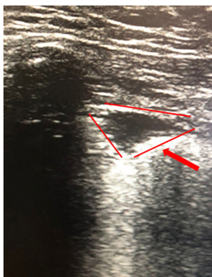
Figura 1 Imagen hipocogénica triangular de base periférica compatible con infarto pulmonar.