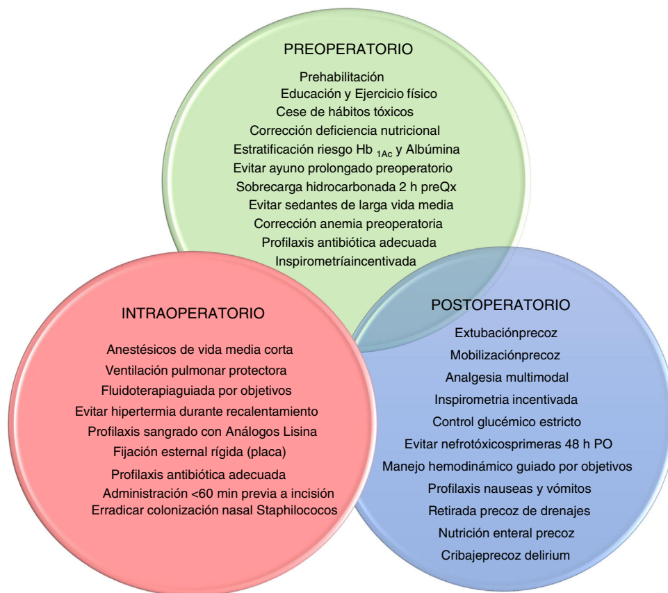
Figura 1 Distintas etapas perioperatorias de las recomendaciones. PO: postoperatorio; preQx: prequirúrgico.